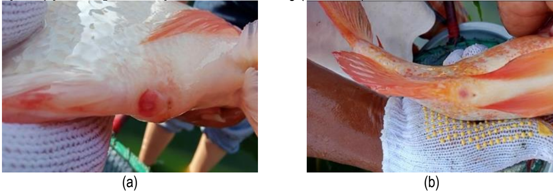
Gambar 1. (a) Induk jantan, (b) Induk betina

Ciri-ciri ikan nila salin betina yang telah matang gonad, adalah sebagai berikut: perut membesar, lubang genital kemerahan dan kelihatan membengkak dan gerakan agak lambat. Sedangkan nila salin jantan, yaitu tubuh membulat, warna cerah, gerakan lincah, salah satu lubang kelaminnya memanjang dan jika dipijat lubang kelaminnya keluar cairan bening (Gambar 1).